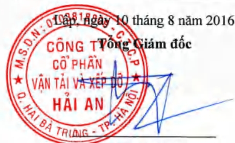
Tạ Mạnh Cường