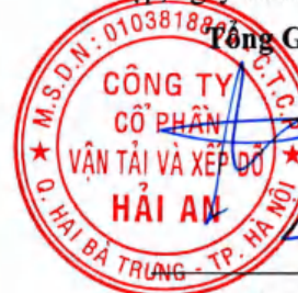
Tạ Mạnh Cường