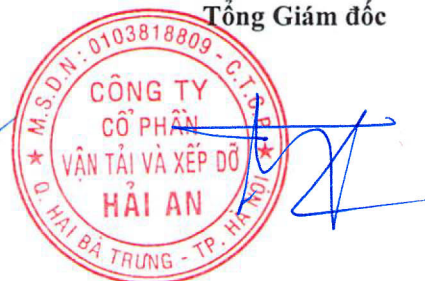
Tạ Mạnh Cường