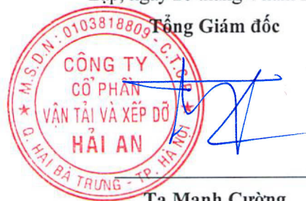
Tạ Mạnh Cường