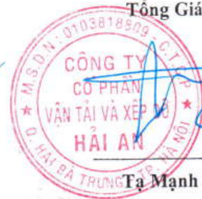
Ta Mạnh Cường