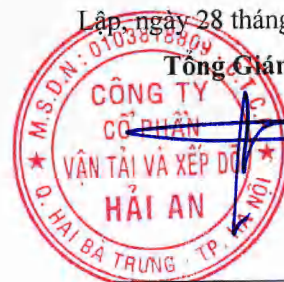
Tạ Mạnh Cường