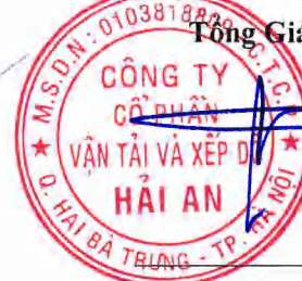
Tạ Mạnh Cường